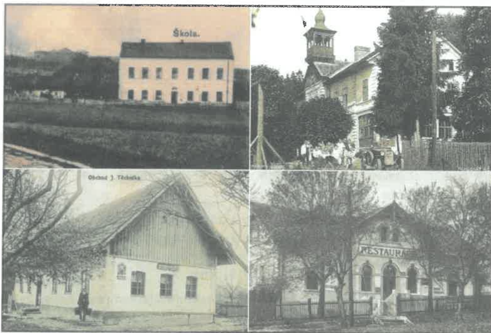
HOLÍN (škola) - r. 1910, HORNÍ LOCHOV (pensionát) - r. 1929, PÁŘEZSKÁ LHOTA (obchod) - r. 1918, PRACHOV (restaurace) - r. 1931

V případě že vlastníte historické foto Vaší obce, prosím o jejich zaslání a postupně je zde zveřejníme. Foto naskenujte a zašlete na obec@holin.cz s poznámkou Zpravodaj. Do e-mailu dopište číslo popisné, nebo jiné skutečnosti, které s fotografií souvisí.